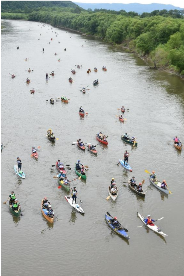
▲佐久橋上流一斉スタート