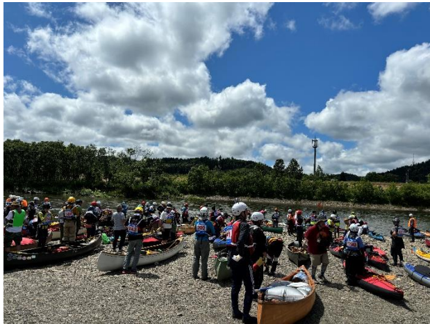
▲中川町スタート会場